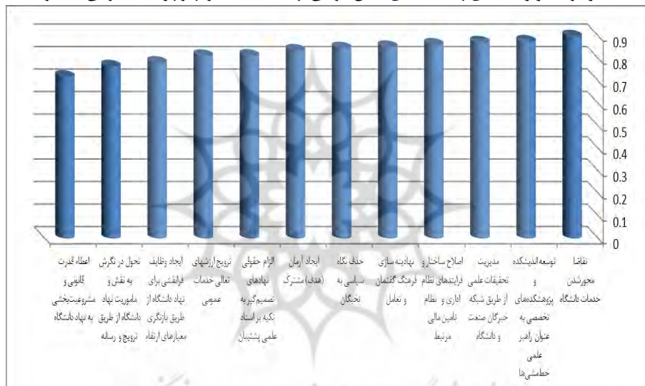
نمودار ۱. اولویت‌بندی پیشایندهای نقش‌آفرینی نهاد دانشگاه در چارچوب حکمرانی همکارانه

فوق ملاحظه می‌گردد اختلاف میانگین فازی‌زدایی شده (مقدار کریسپ) در دو مرحله کمتر از ۰/۱ می‌باشد؛ این بدان معناست که خبرگان در خصوص پیشایندها و پسایندهای نقش‌آفرینی نهاد دانشگاه در چارچوب حکمرانی همکارانه به اجماع نظر رسیده‌اند و در همین مرحله نظرسنجی متوقف می‌شود، در واقع خبرگان به راهبردهای موثر شناسایی شده در پژوهش حاضر نگاه تقریباً یکسانی دارند. با توجه به مطالب ذکر شده، در نهایت تمامی پیشایندها و پسایندهای نقش‌آفرینی نهاد دانشگاه در چارچوب حکمرانی همکارانه در قالب نمودار زیر نشان داده شده است.