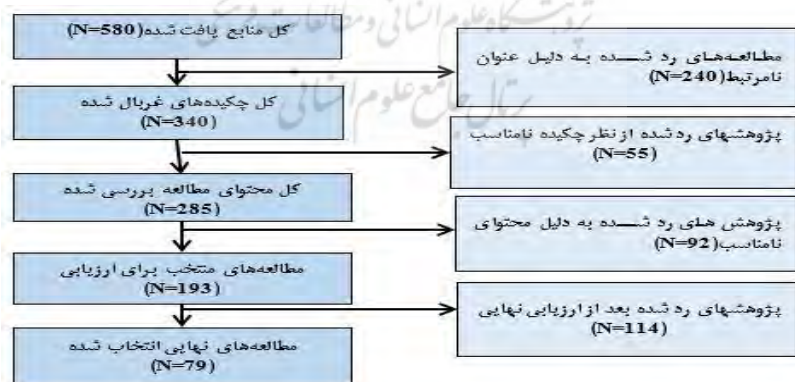
شکل شماره ۱: فرایند بازبینی و انتخاب مقالات

در این مرحله، پژوهشگر با هدف افزایش کیفیت نتایج پژوهش، مقاله‌های باقیمانده از نظر کیفیت روش‌شناختی را با استفاده از ابزار کنترل کیفیت روبریک (CASP) بر اساس ده معیار ارزیابی کیفیت (وضوح اهداف و اهمیت پژوهش، تناسب و تطابق روش پژوهش، تناسب و تطابق طرح پژوهش، تناسب روش انتخاب مشارکت‌کنندگان، تناسب روش جمع‌آوری داده‌ها، رابطه پژوهشگر و مشارکت‌کنندگان، ملاحظات اخلاقی، دقت تجزیه و تحلیل، بیان روشن یافته‌ها و ارزش پژوهش) مورد بررسی قرار داد. تعداد ۵۸۰ مقاله انتخاب شده در مرحله قبل مورد ارزیابی قرار گرفت و بر اساس معیارهای ده‌گانه، ۷۹ مقاله از نظر ساختاری و محتوایی انتخاب شد. فرآیند بازبینی و انتخاب در این پژوهش به صورت خلاصه در شکل شماره ۱ نشان داده شده است. پس از پالایش و انتخاب مقالات نهایی مرتبط با موضوع پژوهش، مطابق جدول شماره ۱ پیوست، به هریک از مقالات یک کد از C۰۱ تا C۷۹ اختصاص داده شد تا محتوای آن با استفاده از نرم افزار، جهت یافتن ابعاد مقوله‌های اصلی و مقوله‌های فرعی الگو مورد تحلیل و جستجو قرار گیرد.