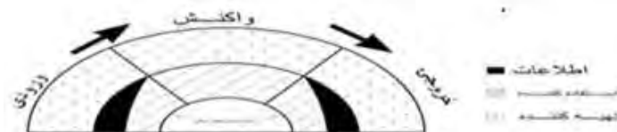
شکل شماره ۲. مدل ترکیبی

در مدل اولیه محور اطلاعات، استفاده‌کننده و تهیه‌کننده مرتب تکرار می‌شوند. لذا در مدل ترکیبی پدید آمده استفاده از صورت‌های مالی با توجه به این اجزا ارائه شد. (شکل شماره ۲)