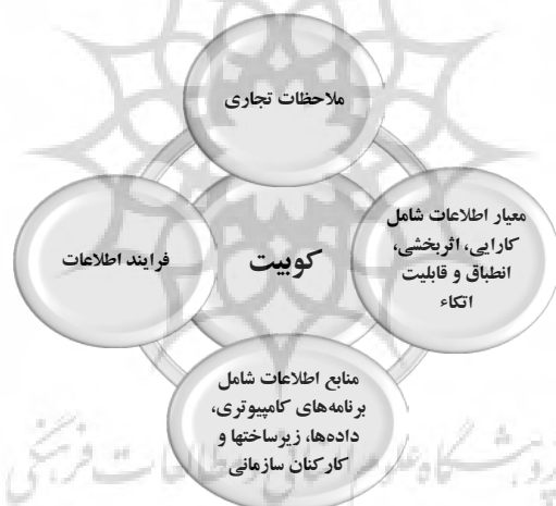
نمودار ۲. مدل مفهومی حسابرسی بر مبنای کوییت

سرعت روزافزون تکنولوژی‌ها، سیستم‌های اطلاعاتی توسعه یافته و پردازش اطلاعات الکترونیک منجر به افزایش توجه به حسابرسی فناوری اطلاعات و تدوین رهنمودها و استانداردهای کنترل داخلی گردیده که این امر تغییر فرایند راهبری سازمان‌ها و تمرکز بر اثربخشی عملیاتی و اتخاذ تصمیم بهینه را به دنبال داشته است (یانگ و گوآن، ۲۰۰۴). در این راستا، ایالات متحده با تلاش نهادهای مسئول مختلف مانند انجمن حسابداران رسمی آمریکا (AICPA) و انجمن کنترل و حسابرسی سیستم‌های اطلاعاتی (ISACA) استانداردهایی را به منظور تسهیل فرایند و ارائه رهنمود به حسابرسان منتشر نمودند. براساس استاندارد شماره ۳ حسابرسی که توسط انجمن حسابداران رسمی آمریکا صادر گردیده اهداف مورد انتظار در ایجاد کنترل‌های حسابداری در سیستم‌های دستی و سیستم‌هایی که تحت فناوری اطلاعات کار می‌کنند بصورت یکسان در نظر گرفته شده‌اند؛ اگرچه فرایندهایی که توسط یک حسابرس اجرا می‌شوند بر این اهداف اثرگذار خواهند بود. به‌طور کلی مدل مفهومی حسابرسی فناوری اطلاعات بر مبنای کوییت به شرح زیر قابل ارائه می‌باشد.