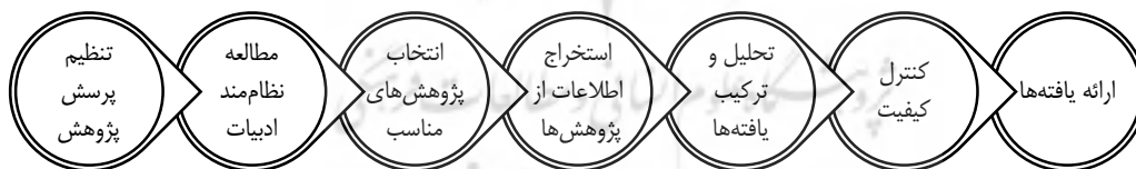
شکل ۱. گام‌های فراترکیب پژوهش

در پژوهش حاضر از روش فراترکیب استفاده شده است. بنابراین، رویکرد پژوهش، کیفی و روش آن، فراترکیب است. فراترکیب شامل بازنگری عمیق، دقیق و تحلیل کیفی محتوای مطالعات گذشته و یافته‌های پژوهش‌های اجرا شده در یک حوزه خاص [۲۴] و ترکیب اطلاعات و داده‌های کیفی حاصل از این تحلیل به منظور ایجاد دانش جدید و نمایش جامع‌تری از پدیده در حال بررسی است [۱۵۵]. برای اجرای روش از هفت مرحله‌ای [۱۴۶] مطابق شکل ۱ استفاده شد که در ادامه توضیحاتی در خصوص هر مرحله ارائه شده است.