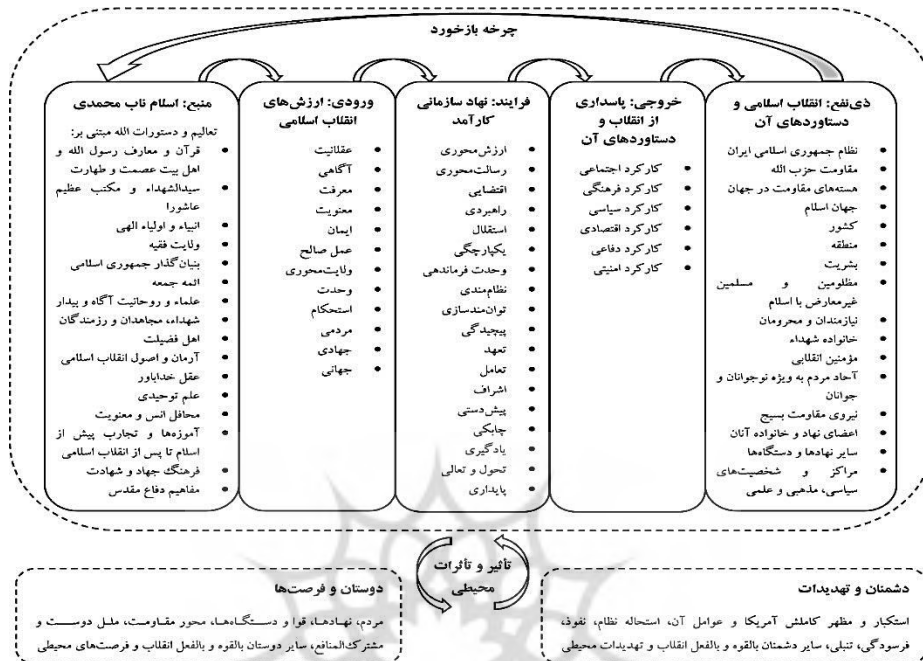
شکل ۱. الگوی سیستمی ویژگی‌های زمینه‌ای نهادهای انقلاب اسلامی

پویایی‌شناسی سیستم‌ها، دیدگاه و مجموعه‌ای از ابزارهای مفهومی به منظور درک ساختار و پویایی سیستم‌های پیچیده است (استرن، ۲۰۰۰؛ ترجمه برارپور و همکاران، ۱۳۸۸: ۷). مدل‌سازان پویایی‌شناسی می‌کوشند مسئله را به صورت الگویی رفتاری در طول زمان نشان دهند (همان: ۱۵۱). مدل‌سازی یک مسئله و نه یک سیستم، استفاده از روش‌های و ابزارهای مکمل، آزمایش و اصلاح مداوم مدل، درک بازخوردها و پرهیز از جزئیات بسیار زیاد، از جمله اصول توسعه مدل‌های پویایی‌شناسی است (همان: ۱۳۸-۱۴۰).