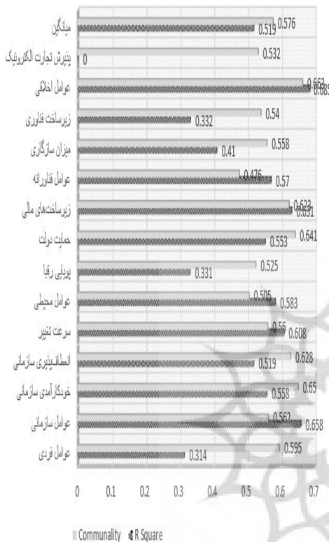
شکل شماره ۳: بررسی معیار GOF