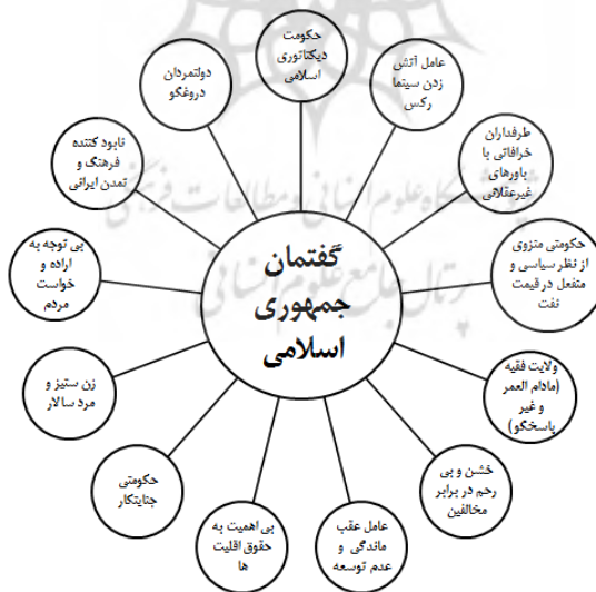
شکل ۲: چگونگی بازنمایی جمهوری اسلامی در گفتمان شبکه «من‌وتو»

شبکه «من‌وتو» با تأکید بر نابودی سرمایه‌های مالی و انسانی کشور توسط دولت جمهوری اسلامی، سپاه پاسداران و فرماندهان آن، دولتمردان، نهاد ریاست جمهوری، رهبر انقلاب و انقلابیون را به‌عنوان عناصر و ارکان حکومت جمهوری اسلامی را به‌صورت منفی بازنمایی کرده است. با توجه به مواردی که مطرح شد و مواردی که در زیر به آن‌ها اشاره می‌شود، شبکه «من‌وتو» درصدد بازنمایی منفی گفتمان جمهوری اسلامی بوده است.