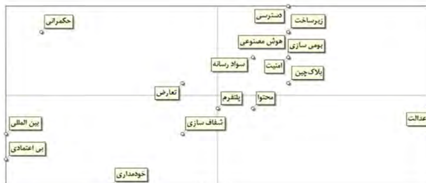
شکل (۱): نقشه پراکندگی متغیرها بر مبنای نرم‌افزار میک‌مک

با توجه به نتایج به دست آمده و نقشه پراکندگی عوامل در محور تأثیرپذیری و تأثیرگذاری، عدم قطعیت‌های کلیدی آینده شبکه‌های اجتماعی مجازی به ترتیب شامل حکمرانی (حکمرانی باز/حکمرانی کنترلی) و تعارض منافع (مدیریت تعارض منافع / افزایش تعارض منافع) است که از تلاقی آنها چهار فضای سناریویی از آینده شبکه‌های اجتماعی مجازی خارجی ایجاد شد.