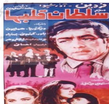
فیلم قیصر ۱۳۴۸ محصول آریا فیلم / فیلم سلطان قلبها ۱۳۴۷ محصول آذر شیوا