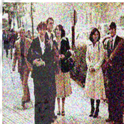
www.tasnm news.com/ خبر گذاری تسنیم