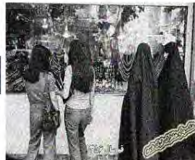
(نشریه، ۵ اصغر/حجاب خوب، حجاب بد)/مجله اقیانوس آبی/لباس محلی کردستان