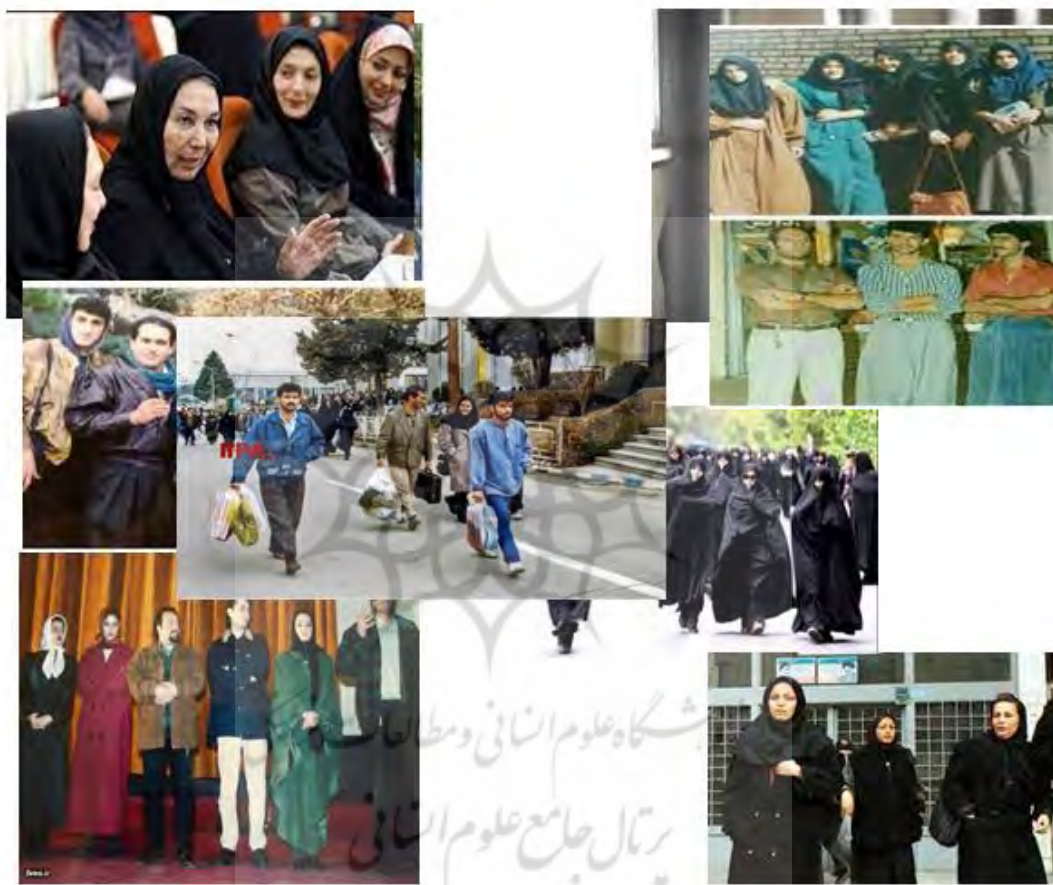
اعتماد آنلاین/ایران ناز/بو خط نیوز/روز پلاس/پرتوین ها

پوشاک زنان بعد از انقلاب اسلامی ایران پوششی کامل که به نام حجاب که ارزشی اساسی برای حفظ مصونیت اخلاقی و روانی زن به هنگام حضور در عرصه های گسترده علمی اجتماعی، سیاسی، اقتصادی و هنری و... جلوه می کند و می درخشد. حجاب پوشش برازنده زن مسلمان معتقد است که بهترین شاخصه های فرهنگ ملی و دینی ملل مسلمان قلمداد می شود، لباسی که نه تنها به جاذبه های ظاهری زن، دامن نمی زند که جلوه های صوری او را میپوشاند تا خصوصیات انسانی او تجلی روشن تری بیابد و هویت نقش آفرین او را بهتر بنمایاند.