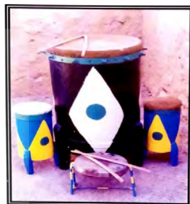
تصویر (۲) - ساز دهل (شریفیان، ۱۳۸۴: بخش تصاویر) تصویر (۳) - فرزند شیخ فرج سازنده ساز دهل (شریفیان، ۱۳۸۴: بخش تصاویر)

در این مراسم، بسته به نوع زار، از سازهای دیگری نظیر طار (دف)، دمام، دایره زنگی، نی جفتی و هبان (نی انبان) استفاده می‌شود. در گذشته از تمبوره و سنجه نیز استفاده می‌شده است. در قطعه‌ی سنج و دمام، سازهای بوق، دمام و سنج نواخته می‌شوند. سازهای مذکور در زمره نخستین آلات موسیقی بوده و در ضمن آنکه در زمره‌ی سازهای جنگلی محسوب می‌شوند، ریشه در موسیقی آفریقا دارند. (شریفیان، ۱۳۸۳: ۱۴۸ و ۱۶۵)