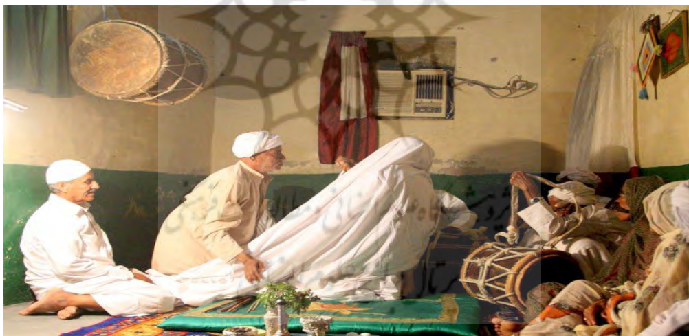
تصویر (۱) - مراسم زار در هرمزگان (شریفیان، ۱۳۸۴: بخش تصاویر)

تحقیقات میدانی اولیه‌ی این پژوهش توسط محسن شریفیان در طول مسافرت‌های خود به منطقه هرمزگان طی سال‌های ۱۳۷۷ تا ۱۳۸۰ درباره مراسم شیخ فرج در خارگ و نحوه درمان را با چشم و گوش خود دیده و شنیده است. (شریفیان، ۱۳۸۴، ۶)