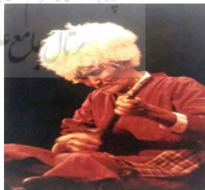
تصویر (۱۱) - ساز دوتار ترکمن (درویشی، ۱۳۸۸: ۸۳)