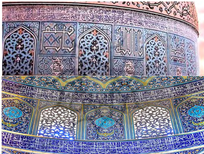
تصویر ۵- نماهای بیرونی و درونی از گریو (ساقه) گنبد با کتیبه های ثلث و کوفی و نقوش شمسه و اسلیمی

فیروزه‌های رنگ، با کتیبه‌های اسماء الهی وجود دارد که این اسامی، چهار بار به دور گنبد در میان شانزده پنجره بیرونی با رنگی سفید تکرار شده که نماد وحدت است. می‌توان گفت این چهار اسم همه جهات را در بر گرفته و در همه جهات انعکاس یافته و یا دور یک مرکز در حال چرخشند و گویا همه فضای مسجد را در بر گرفته اند. (ظفری نائینی، ۱۳۹۶: ۱۱) بر اساس یک روایت، خداوند اسماء اش را برقرار ساخت و سپس آنها را در حضرت محو گرداند. حضرت الهی، اشاره به حالات و یا مقاماتی است که در آنها، وجود مطلق، خودش را در یکی از صور اسماء الهی بر سالک آشکار می‌سازد. (معمارزاده، ۱۳۸۶: ۱۹۷-۱۹۸) بُعد نامتناهی رحمن به صورت کمال ثابتی به شکل اسلیمی نشان داده می‌شود که بیانگر موزون بودن، یکسانی و برای مخلوقات گشایش و کمال و بسط است ولی بُعد رحیم، کمال پویایی و مخلوقات را ناتوان و محدود می‌سازد و بیانگر همان قبض و بقا است که اشکال هندسی آن را نمایش می‌دهند و خداوند نیز به واسطه اسماء اش، خودش را بر بنده خویش آشکار می‌گرداند. (ظفری نائینی، ۱۳۹۶: ۱۱)