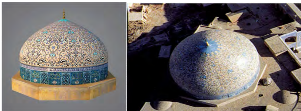
تصویر ۱- نمای از بالای گنبد (دانش‌نامه تخصصی معماری ایرانشهر) تصویر ۲- نمایی کلی از گنبد مسجد شیخ لطف‌الله