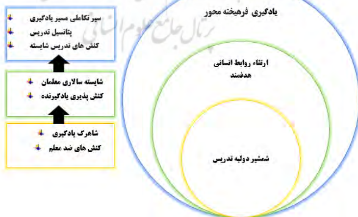
شکل ۲: الگوی مفهومی عوامل مؤثر بر اجرای الگوهای نوین تدریس به مثابه یادگیری بادوام

از تحلیل و دسته بندی توضیحات مشارکت کنندگان، مضمون اصلی شمشیر دولبه تدریس، به مضامینی چون شاهرگ یادگیری و کنش های ضد معلم توجه می کند. نمونه ای از پاسخ مشارکت کنندگان: «تمام اطلاعاتی که ما دریافت می کنیم، زمانی معنی دار و قابل فهم خواهد بود، که بتوانیم آن را با آنچه که قبلاً در ذهن داشتیم، مرتبط سازیم؛ اگر اطلاعات پیش نیاز را نداشته باشیم و یا قادر به سازماندهی و مرتبط ساختن اطلاعات به یکدیگر نباشیم، اطلاعات به صورت طوطی وار در ذهن ما باقی می ماند.» (مشارکت کنندگان ۴، ۵، ۳، ۱۰، ۱۱، ۱۲، ۱۳، ۱۴)؛ «زمانی که معلم می خواهد فعالیتی فراتر از آموزش انجام دهد، به دلیل بسته بودن دیدگاه کادر مدرسه و دیگر دیگران، در انجام آن دچار چالش می شود؛ به همین دلیل انگیزه و رغبت چنین معلم خلاق، برای انجام چنین فعالیت هایی، سلب می شود.» (مشارکت کنندگان ۴، ۱، ۷، ۲۵، ۱۱، ۱۵).