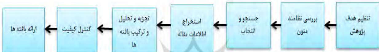
شکل ۱: گام‌های سنتز پژوهی بر اساس روش هفت مرحله‌ای (سندلوسکی و باروسو، ۲۰۰۷)

انگلیسی واژگان شامل Competence of managers در پایگاه‌های اطلاعاتی کتابخانه‌ها، پژوهشکده‌ها و سایت‌هایی همچون جهاد دانشگاهی، پایگاه مجلات تخصصی نور، مگیزان، مقالات علمی همایش‌های کشور، پایگاه نشریات کشور، ایران داک، سیویلیکا، علم نت و پایگاه‌های استنادی و اطلاعاتی معتبر خارجی شامل Google Science Direct ، IEEE ، Springer ، Scopus ، Scholar مورد جستجو قرار گرفت. همچنین از پارامترهای مختلفی مانند عنوان، چکیده، محتوا، دسترسی و کیفیت روش پژوهش برای ارزیابی و انتخاب مقالات استفاده شد. برای دستیابی به هدف پژوهش از روش سنتز پژوهی، مطابق با الگوی سندلوسکی و باروس استفاده شد که خلاصه این مراحل در شکل ۱ نشان داده شده است.