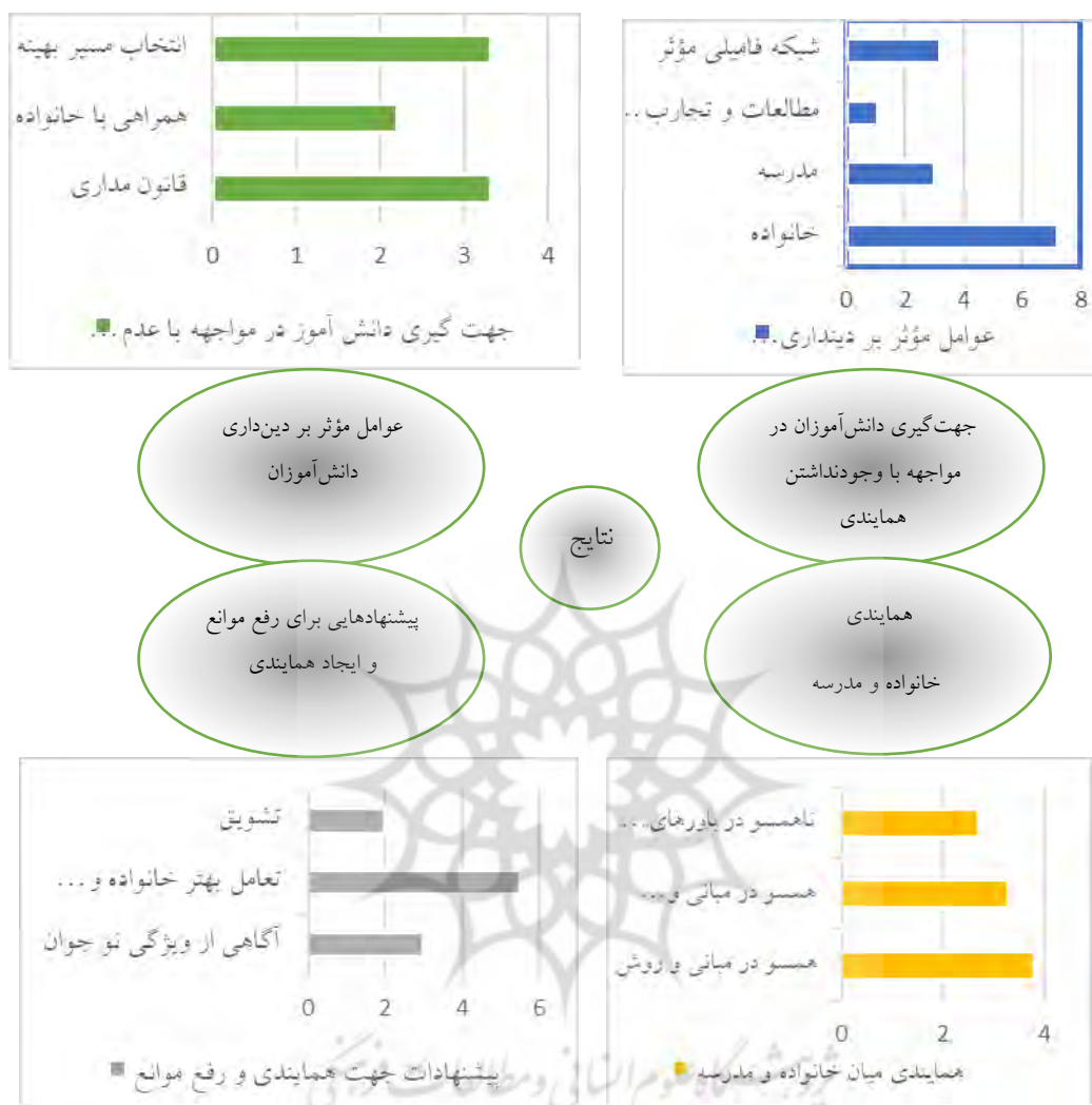
شکل ۲. نتایج پژوهش