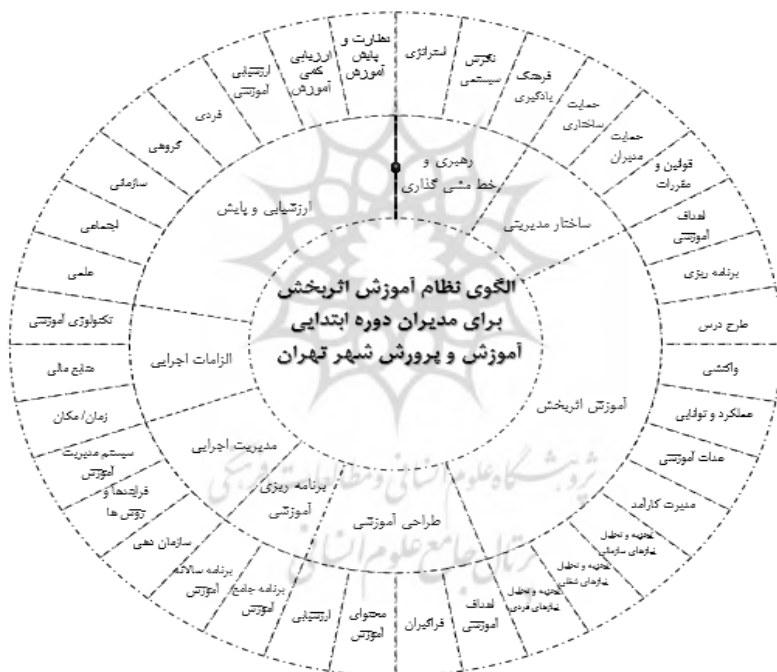
شکل ۱: الگوی نظام آموزش اثربخش برای مدیران دوره ابتدایی آموزش و پرورش شهر تهران

پس از تجزیه و تحلیل پرسشنامه‌های به دست آمده الگویی ارائه شد مشتمل بر ۸ بعد: رهبری و خط‌مشی گذاری، ساختار مدیریتی، آموزش اثربخش، طراحی آموزشی، برنامه ریزی آموزشی، مدیریت اجرایی، الزامات اجرایی، ارزشیابی و پایش می باشند و ۳۶ مؤلفه استراتژی، نگرش، سیستمی، فرهنگ یادگیری، حمایت ساختاری، حمایت مدیران، قوانین و مقررات، اهداف آموزشی، برنامه ریزی، طرح درس، واکنشی، عملکرد و توانایی، عدالت آموزشی، مدیریت کارآمد، تجزیه و تحلیل نیازهای سازمانی، تجزیه و تحلیل نیازهای شغلی، تجزیه و تحلیل نیازهای فردی، اهداف آموزشی، فراگیران، محتوای آموزش، ارزشیابی، برنامه جامع آموزش، برنامه سالانه آموزش، سازمان-دهی، فرایندها و روش‌ها، سیستم مدیریت آموزش، زمان/ مکان، منابع مالی، تکنولوژی آموزشی، علمی، اجتماعی، سازمانی، گروهی، فردی، ارزشیابی آموزشی، نظارت و پایش آموزش است. الگوی مذکور مرکب از ۱۵۴ شاخص است.