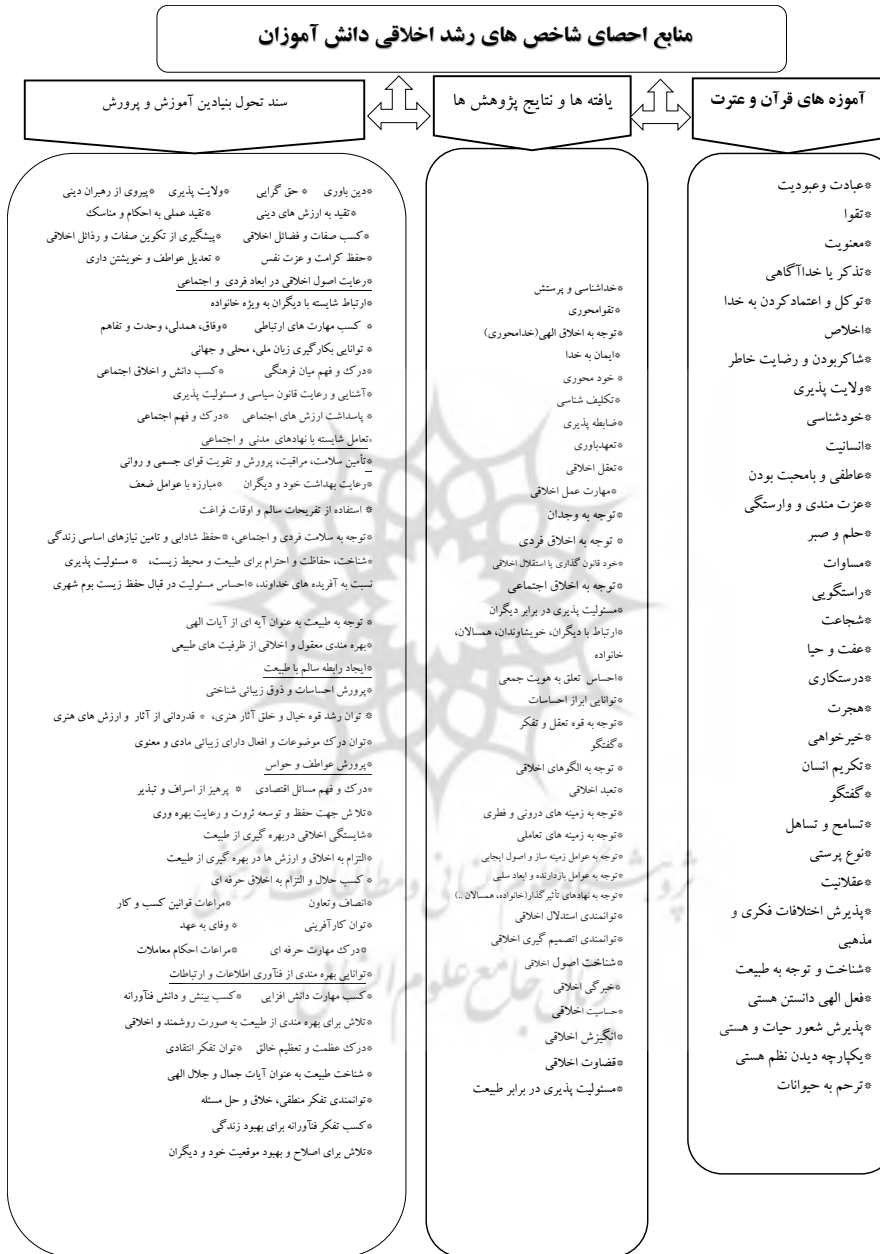
جدول ۱: اصطلاحات و کلیدواژه‌های جستجوی اسناد علمی