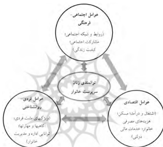
شکل (۱) مدل چندبُعدی توانمندسازی زنان سرپرست خانوار

چرخه‌ای بودن فرآیند توانمندسازی به این معناست که در آن عوامل و ابعاد مختلف اجتماعی-فرهنگی، اقتصادی و فردی-روانشناختی متقابلاً بر هم اثرگذارند و چگونگی توانمندسازی زنان سرپرست خانوار را تعیین می‌کنند. همچنین در این فرآیند، سطح توانمندی این زنان بر وضعیت اجتماعی-فرهنگی، اقتصادی و فردی-روانشناختی اثرگذار است. در واقع عوامل مذکور یکدیگر را تقویت و تشدید می‌کنند. در این مدل، روابط بین عوامل و متغیرها نه خطی بلکه چرخه‌ای است.