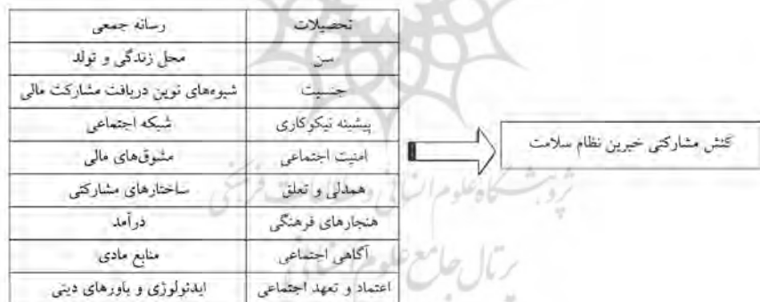
شکل (۱) مدل مفهومی تحقیق

در حالت کلی، عوامل متعددی بر مشارکت خیرین در نظام سلامت اثرگذار است که به عوامل فرهنگی- اجتماعی، اقتصادی و زمینه‌ای تقسیم می‌شود. عوامل زمینه‌ای در واقع عوامل کالبدی و محیطی مؤثر بر مشارکت‌کننده است. عوامل فرهنگی- اجتماعی، عواملی برخاسته از ساختارها و نهادهای اجتماعی جامعه‌ای است که فرد در آن زندگی می‌کند و عوامل ارزشی و مؤثر در بایدها و نبایدهای زندگی افراد است. عوامل اقتصادی، عوامل متأثر از درآمد، شغل و دسترسی به منابع مادی و درآمد است. در تحقیق حاضر به بررسی روابط میان این عوامل با کنش مشارکتی خیرین در نظام سلامت ایران پرداخته می‌شود. بر این اساس، مدل مفهومی تحقیق، در شکل شماره (۱) قابل مشاهده است.