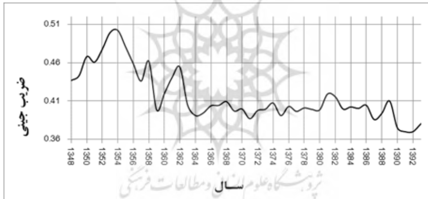
نمودار (۲) روند متغیر ضریب جینی طی سالهای ۱۳۴۸-۱۳۹۳

در این حالت عدد ضریب جینی معادل ۰/۳۸۳۸ می‌تواند به عنوان مقدار بهینه این متغیر در نظر گرفته شود که حداکثرکننده تولید ناخالص داخلی سرانه می‌باشد. یعنی در نرخهای پایین‌تر از این رقم، افزایش نابرابری از طریق کانالهایی که تشریح شد، می‌تواند منجر به افزایش تولید ناخالص داخلی سرانه گردد و برعکس در نرخهای بالاتر نیز عواملی باعث کاهش این متغیر می‌گردند.