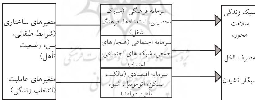
نمودار شماره ۱: مدل تحلیلی پژوهش