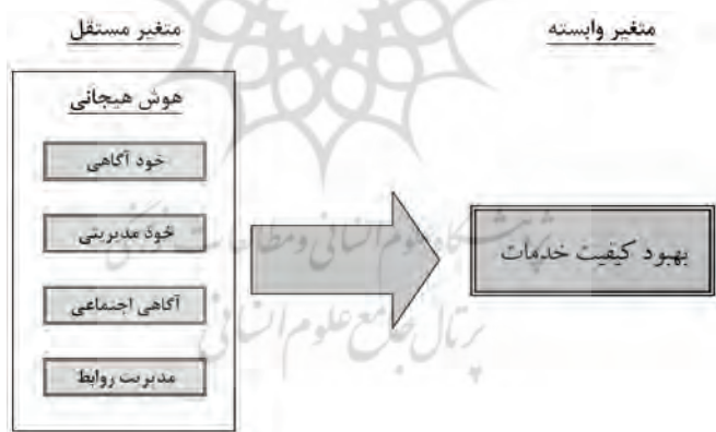
شکل ۲. مدل مفهومی تحقیق (دانیل گلמן، ۱۹۹۸)

مدل نظری تحقیق حاضر، براساس چارچوب هوشی هیجانی دانیل گلמן است که شامل چهار حوزه و بیست قابلیت است. شکل ۲ مدل مفهومی و متغیرهای مستقل و وابسته را نشان می‌دهد.