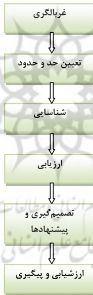
شکل ۲- مراحل فرایند ارزشیابی اثرات بر سلامت

است. نکته مهم این است که گزارش به شکلی فهم‌پذیر و به‌زبانی درک‌شدنی ارائه شود؛ زیرا مخاطبان آن، به‌ندرت از متخصصان سلامت هستند. ع- ارزشیابی و پیگیری ۱ : در مرحله آخر، برای اطمینان از اثربخش بودن فرایند ارزشیابی اثرات بر سلامت و دستیابی آن به اهداف مربوط، ارزشیابی انجام می‌شود. این مرحله شامل ارزشیابی فرایند ارزشیابی اثرات بر سلامت و ارزشیابی نحوه اجرای پیشنهادهای ارائه شده، پس از بررسی تأثیر در مراحل قبلی است. در واقع، نظارت بر قبول توصیه‌ها و اجرای آن‌ها پس از قبول، یا نظارت بر شاخص‌ها و پیامدهای سلامتی پس از اجرای طرح پیشنهادی است. این مرحله نیز با برگزاری چند کارگاه با مسئولان و تیم ارزشیابی انجام می‌گیرد (هریس، ۲۰۰۷).