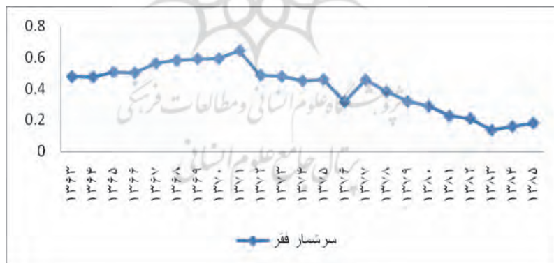
نمودار ۲. روند فقر