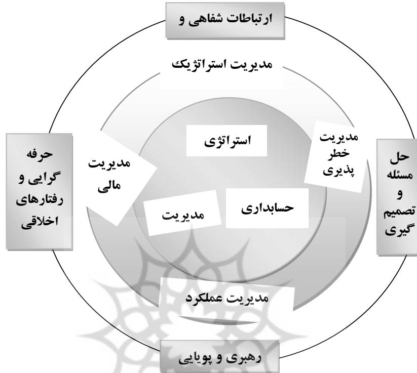
شکل (۳): الگوی شایستگی‌های شرکت CMA

این الگو، که توسط شرکتی با عنوان مشاوران مدیریت مالی ۲ ارائه شده با توجه به تأکید بر مدیریت، حسابداری و استراتژی شایستگی‌ها در قالب‌های زیر تعریف شده است: رهبری و پویایی گروهی، حرفه‌گرایی و رفتارهای اخلاقی، ارتباطات شفاهی و نوشتاری، حل مسئله و تصمیم‌گیری، مدیریت عملکرد، اندازه‌گیری عملکرد، مدیریت منابع مالی، گزارش دهی مالی، مدیریت استراتژیک، مدیریت خطرپذیری.