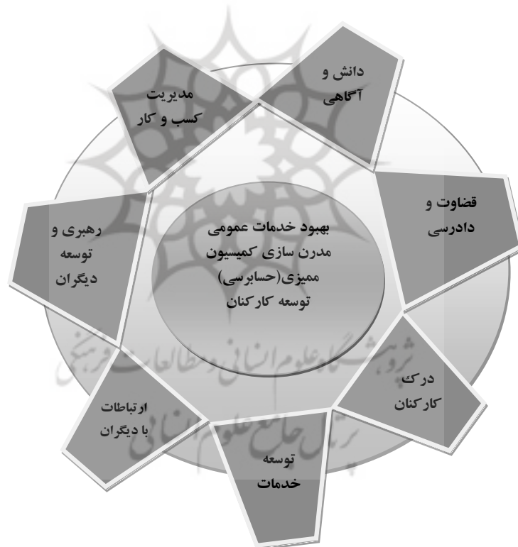
شکل (۱): الگوی شایستگی هفت عامله

در الگو چارچوب شایستگی با سه هدف اصلی بهبود خدمات عمومی، مدرن سازی کمیسیون ممیزی (حسابرسی) و توسعه کارکنان تعریف شده است. شایستگیها در