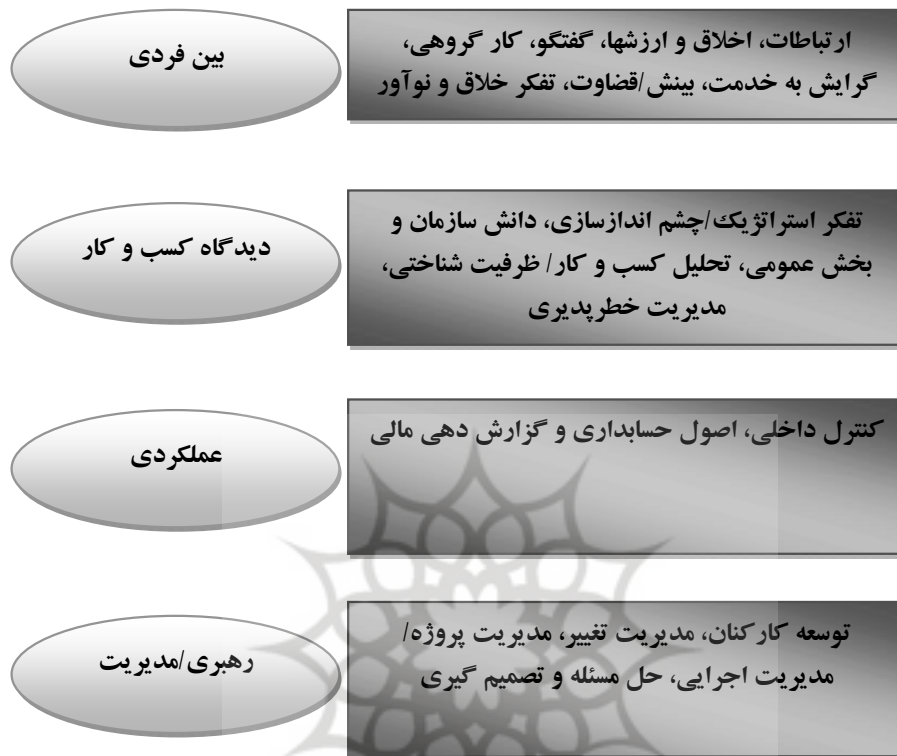
شکل (۴): الگوی شایستگیها

در الگو فوق شایستگیها در چهار دسته بندی کلی بین فردی، دیدگاه کسب و کار، عملکردی و رهبری/مدیریت عنوان شده است. ۱ دسته بندی فردی شامل ارتباطات، اخلاق و ارزشها، گفتگو، کار گروهی، گرایش به خدمت، بینش/قضاوت، تفکر خلاق و نوآور است. دیدگاه کسب و کار شامل تفکر استراتژیک/چشم اندازسازی، دانش سازمان و بخش عمومی، تحلیل کسب و کار/ ظرفیت شناختی، مدیریت خطرپذیری است. فرایند سیستم، کنترل داخلی، اصول حسابداری و گزارش دهی مالی است. دیدگاه رهبری شامل توسعه کارکنان، مدیریت تغییر، مدیریت پروژه/مدیریت اجرایی، حل مسئله و تصمیم گیری است.