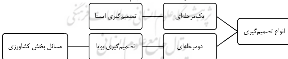
شکل ۱- اشکال تصمیم‌گیری

یکی از دلایلی که حکمرانی کشاورزی کارکردهای اصلی خود را ندارد، همین جزیره‌ای کار کردن است. برای مثال، در کشور وزارت