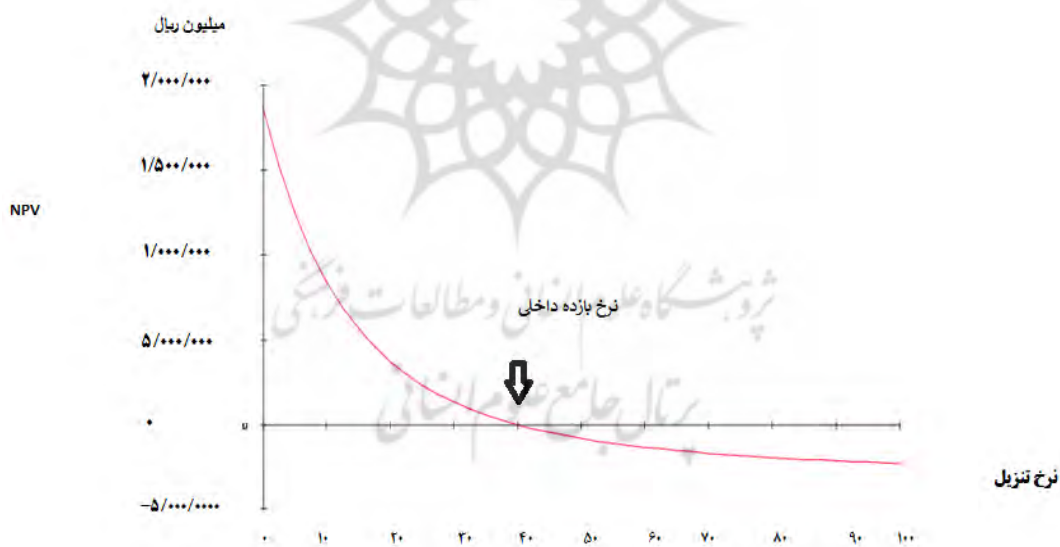
نمودار ۱. خالص ارزش فعلی کل سرمایه پروژه پارک ترافیک (بخش آموزشی)

نتایج محاسباتی بالا نشان می‌دهد که طرح از لحاظ اقتصادی توجیه‌پذیر است. ارزش فعلی خالص طرح مثبت است؛ نرخ بازده داخلی بیشتر از میزان نرخ بازدهی مورد انتظار سرمایه‌گذار (نرخ تنزیل ۲۰٪) است و دوره بازگشت سرمایه نشان‌دهنده این است که هزینه‌های سرمایه‌گذار به وسیله درآمدها، در سال چهارم پوشش داده می‌شود.