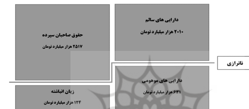
شکل ۱. مفهوم ناترازی ۱.

مقصود از ناترازی این است که ارزش واقعی مجموع دارایی‌های نظام بانکی از مجموع تعهدات بانک‌ها به سپرده‌گذاران کمتر است. براساس تعریف کمیته استانداردهای حسابداری مالی ارزش دارایی‌های مالی بانک براساس جریان نقد ورودی تعدیل شده آن دارایی محاسبه می‌شود؛ بنابراین مفهوم این که ارزش دارایی‌های یک بانک کمتر از میزان سپرده‌های آن بانک است، این است که دارایی‌های بانک جریان نقد ورودی برای بانک تولید نمی‌کنند. ارزش دارایی‌های مالی باید متناظر با جریان نقدی که تولید می‌کنند تعدیل شود. اگر جریان نقد یک دارایی مالی افت کند، اما ارزش دارایی در صورت‌های مالی بانک به صورت متناسب کاهش نیابد، یا زیان حاصل از کاهش ارزش دارایی‌ها جبران نشود ناترازی رخ می‌دهد.