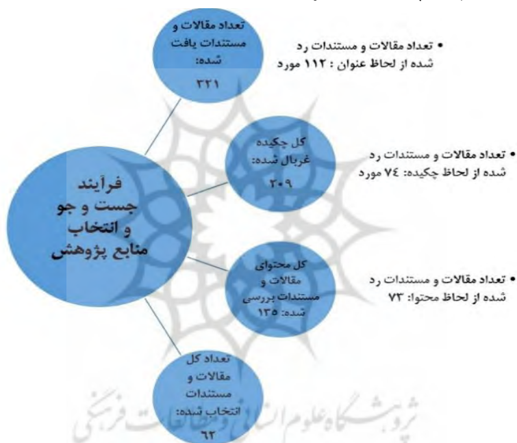
شکل ۱- فرآیند جست‌وجو و انتخاب منابع پژوهش (مأخذ: یافته‌های پژوهش، ۱۴۰۱)

معیار کیفی ارزیابی کیفی می‌شود. به هریک از منابع بر مبنای این معیارها، امتیازی بین ۱ تا ۵ اختصاص داده شد. منابعی که مجموع امتیاز آنها، ۲۵ یا بیشتر باشد، از لحاظ کیفی تأیید و بقیه منابع حذف می‌شوند. ۱۰ معیار کسپ در پژوهش حاضر عبارت‌اند از (۱) تناسب بین هدف منبع بررسی شده با هدف پژوهش حاضر؛ (۲) به‌روزی بودن منبع؛ (۳) چارچوب مطرح شده در منبع بررسی شده؛ (۴) روش نمونه‌گیری؛ (۵) روش پژوهش و کیفیت گردآوری داده‌ها؛ (۶) میزان تعمیم‌پذیری نتایج پژوهش؛ (۷) میزان رعایت نکات اخلاقی در زمینه تدوین متون پژوهشی؛ (۸) میزان دقت در زمینه تحلیل داده‌ها؛ (۹) وضوح بیان در ارائه یافته‌ها؛ (۱۰) ارزش کلی منبع. تعداد مقالات و مستندات (کتاب‌ها و پایان‌نامه‌ها) در هریک