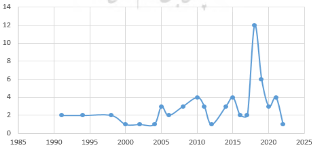
شکل ۲- بازه زمانی جامعه آماری پژوهش