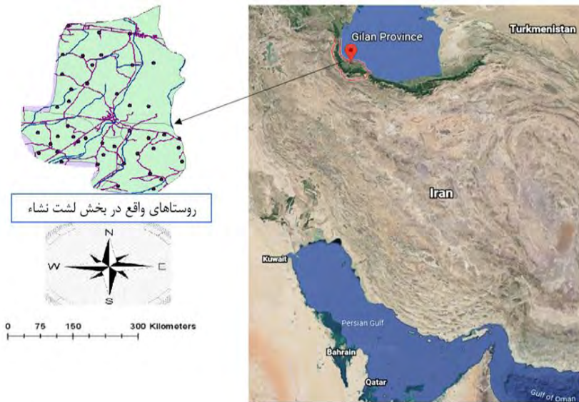
شکل ۱- موقعیت منطقه لشت نشا در شمال ایران.

مورد استفاده پژوهشگران قرار گرفته است. بتازگی (۱۲)، با ترکیب دو الگوی مفهومی نظریه یکپارچه پذیرش و استفاده از فناوری (۴۶) و مدل اعتماد اولیه (۴۷)، یک الگوی ترکیبی طراحی کرده و برای نخستین بار آن را در زمینه بررسی عوامل نگرشی موثر بر اتخاذ اقدام‌های حفاظتی آب و خاک توسط شالی‌کاران مورد بررسی و تجزیه و تحلیل قرار داده‌اند.