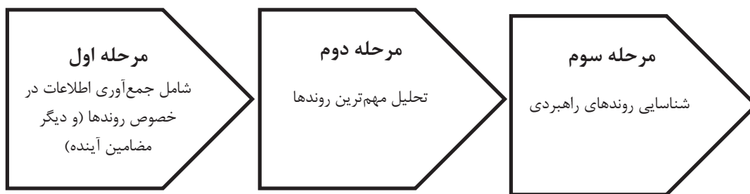
نمودار ۱- روش آینده‌نگاری (حسی‌سازی نشانه‌های آینده) به‌عنوان چارچوب دیده‌بانی (کوواسا، ۲۰۱۰)

۵- اینترنت اشیا صنعتی: ارتباط تمامی تجهیزات به فناوری‌های ارتباطی برای ارتباط و تعامل با واحد کنترل. ۶- امنیت شبکه: حفاظت از سیستم‌های حساس صنعتی و خطوط تولید مهم در برابر حملات سایبری. ۷- سیستم رایانش ابری: مدیریت و تحلیل‌های آماری در شرکت. ۸- تولید افزایشی: تولید نمونه اولیه محصولات با دقت بسیار زیاد و محصولات سفارشی خاص. ۹- واقعیت افزوده: بهبود عملکرد نیروی انسانی از طریق فراهم‌سازی اطلاعات واقعی و بهنگام.