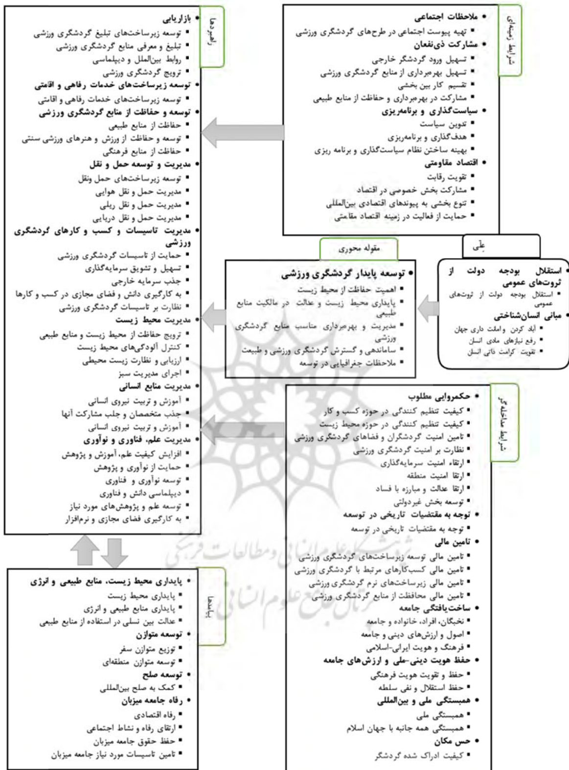
نمودار ۱. الگوی توسعه پایدار گردشگری ورزشی جمهوری اسلامی ایران بر اساس اسناد بالادستی

«مشارکت ذی‌نفعان»، «سیاست‌گذاری و برنامه‌ریزی»