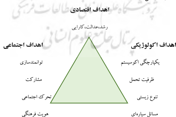
شکل ۲: اهداف توسعه پایدار

در شکل بالا، بُعد اقتصادی به رشد اقتصادی و سایر پارامترهای اقتصادی مربوط می‌شود و در آن رفاه فرد و جامعه از طریق استفاده بهینه از منابع طبیعی و توزیع عادلانه منابع تامین می‌شود. بعد اجتماعی به رابطه انسان با انسان، دسترسی به خدمات، سلامت، بهداشت، آموزش، امنیت، ارزش‌گذاری انسانی، مساوات و فقر زدایی توجه دارد. بعد محیط‌زیست به حفاظت و تقویت منابع فیزیکی، بیولوژیکی، اکوسیستم و رابطه انسان و طبیعت مربوط می‌شود و بعد سیاسی به قانون، سیاست‌گذاری و وضع خط مشی، برنامه‌ریزی، بودجه‌بندی و به طور خلاصه تنظیم وضعیت و شرایط لازم برای تلفیق هدف‌های اقتصادی، اجتماعی و محیط‌زیستی می‌پردازد به نحوی که با برقراری رابطه بین آن‌ها تحقق توسعه پایدار امکان‌پذیری می‌شود. (سازمان ملل، ۲۰۰۱)