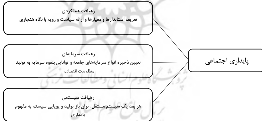
شکل ۳: رهیافت‌های غالب در پایداری اجتماعی