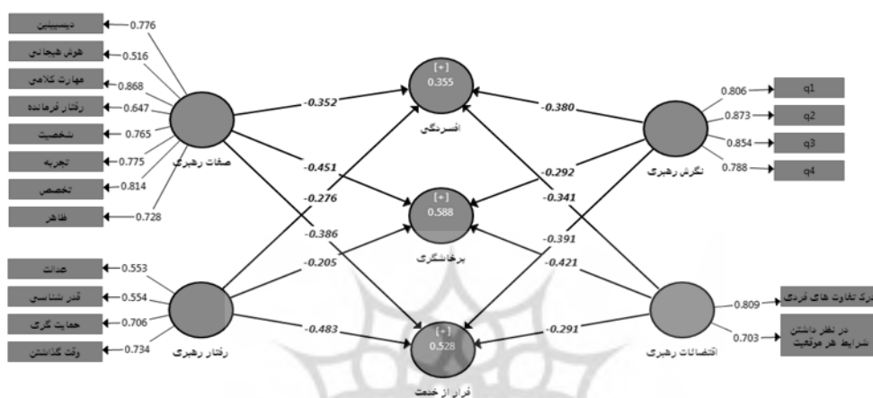
نمودار ۲: ضرایب مسیر استاندارد مدل مفهومی پژوهش

پس از بررسی مدل اندازه گیری، نوبت به بررسی و آزمون مدل ساختاری پژوهش می‌رسد. خروجی گرافیکی مدل پژوهش به صورت نمودار ۲ می‌باشد.