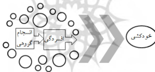
نمودار ۱. مدل مفهومی پژوهش

غمگینی، فقدان لذت و کاهش فعالیت‌های لذت بخش بروز و به تدریج افزایش می یابد (پورحسین و همکاران، ۱۳۹۳: ۳۴). در این خصوص، شرایط حضور سربازان در پادگان‌های نظامی با مسائلی از جمله جداسدن از خانواده و نظام‌های حمایتی، تغییر در عادات روزانه، تغییر در عادات تغذیه، محدودیت در انتخاب و آزادی عمل، انضباط ویژه، تغییر مکان مکرر و اجباری، تغییر در عادات خواب، مشکلات در رابطه با فرمانده و سربازان دیگر و... (فتیحی آشتیانی و سجاده‌چی، ۱۳۸۴: ۱۵۴) منجر به بروز برخی آسیب‌ها از جمله افسردگی شده و به دنبال آن در صورت عدم سازگاری با محیط و شرایط نظامی زمینه برای رفتار خودکشی در آنان ایجاد می شود.