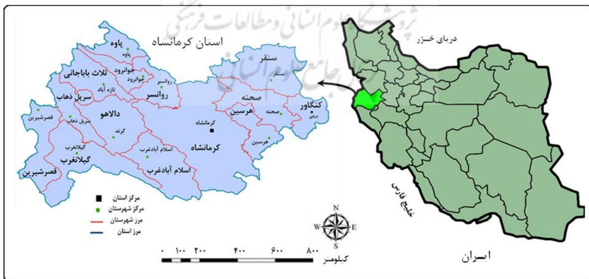
شکل ۲. موقعیت جغرافیایی محدوده مورد مطالعه

استان کرمانشاه با مساحت ۲۴۶۴۰ کیلومتر مربع، هفدهمین استان ایران از نظر وسعت به‌شمار می‌رود. این استان که ۱/۵ درصد مساحت کشور را دربر می‌گیرد از استان‌های غربی کشور به‌شمار می‌آید که با کشور عراق مرز مشترک دارند (شکل ۲). همچنین استان کرمانشاه از شمال به استان