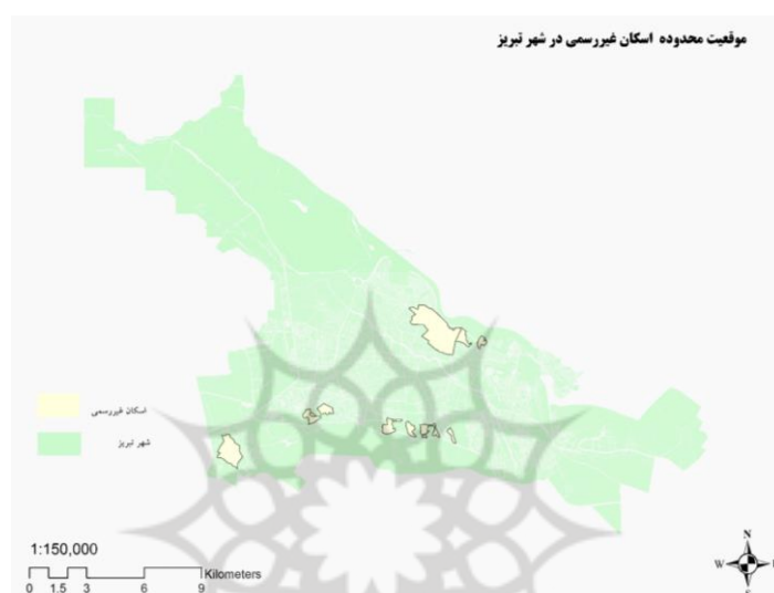
شکل (۱). موقعیت سکونتگاه‌های غیررسمی در شهر تبریز

رواسان و آخماقیه حاشیه‌نشین محسوب می‌شوند. به لحاظ شرایط توپوگرافی، این محلات در شیب‌های بسیار تند واقع شده‌اند و بسیاری از آن‌ها دسترسی سواره ندارند و رفت‌وآمد از طریق پلکان انجام می‌گیرد. نداشتن سیستم فاضلاب و تأسیسات استاندارد از دیگر ویژگی‌های این محلات است. کیفیت مسکن این محلات بسیار پایین و حتی گاه با مصالحی چون خشت و گل می‌باشد. بافت متراکم و غالب مسکونی که بدون هیچ‌گونه فضای باز و سبز می‌باشد در این مناطق به چشم می‌خورد (شکل ۲).