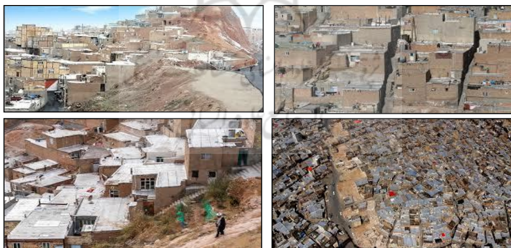
شکل (۲). تصاویری از سکونتگاه‌های غیررسمی شهر تبریز