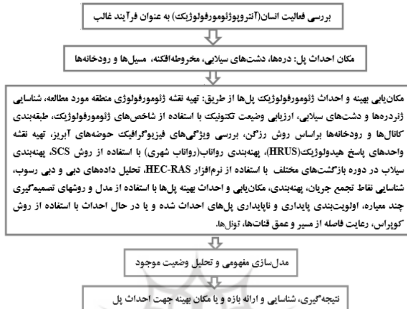
شکل (۴). فلوجارت مراحل بررسی ژئومورفولوژیک مکان‌یابی بهینه و احداث پل‌ها در مسیل - روددره‌ها

مدل مفهومی ژئومورفولوژیک احداث پل‌ها در مسیل - روددره‌ها = {عوامل طبیعی و محیطی (زمین‌شناسی + اقلیم + هیدرولوژی + خاک و ژئوتکنیک + ژئومورفولوژی) + (فعالیت‌های انسان یا عامل آنتروپوژئومورفولوژیک) - (مخاطرات + پیامدهای نامطلوب ژئومورفولوژیک، اجتماعی، اقتصادی، زیست‌محیطی، سیاسی و امنیتی پل)}.