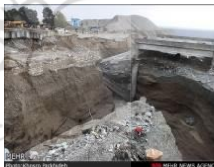
شکل (۱). تخریب پل در جاده قدیم کرج در اواخر آبان ماه سال ۱۳۹۱