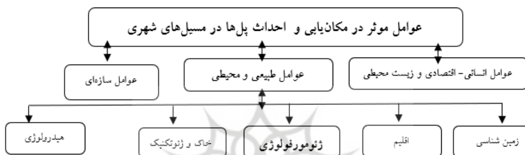
شکل (۳). عوامل مؤثر در مکان‌یابی و احداث پل‌ها در مسیل‌های شهری

امکان عبور و مرور جانوران و موجودات زنده را بدهد و برای ادامه زیست آن‌ها مشکلی وارد نسازد و بررسی وضعیت پوشش گیاهی و جلوگیری از حذف آن‌ها و در مجموع توجه به اکوژئومورفولوژی رودخانه‌ها و مسیل‌ها (...، عوامل سازه‌ای (شکل و هندسه سازه، اندازه (طول و عرض و ارتفاع)، کاربرد و استفاده، نحوه اجرا، مصالح مورد استفاده و ...) عوامل طبیعی و محیطی (ویژگی‌ها و وضعیت زمین‌شناسی، اقلیم، هیدرولوژی، نوع خاک و پوشش گیاهی و از همه مهم‌تر بررسی ژئومورفولوژی منطقه مورد مطالعه) است. در این پژوهش نیز مهمترین فاکتورها و پارامترهایی که علم ژئومورفولوژی می‌تواند در مدل‌سازی احداث پل‌ها ارائه دهد، آورده شده است. در ادامه برخی از پارامترهای مهم در مطالعه و بررسی عوامل طبیعی و محیطی ذکر شده است.