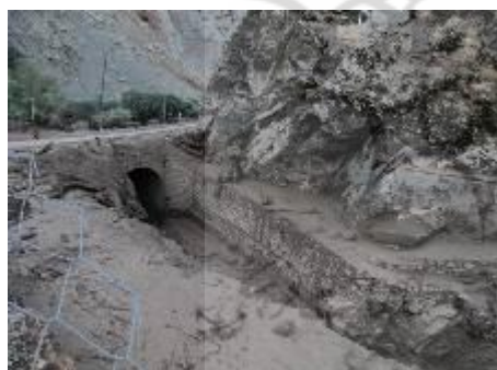
شکل (۲). خسارات سیلاب یکشنبه ۲۸ تیرماه در جاده سنگان (مشرق نیوز، ۱۳۹۴)

فراوانی را در مسیر خود ایجاد کند (معاونت برنامه‌ریزی و نظارت راهبردی ریاست جمهوری، ۱۳۹۳: ۴۶). با توجه به وجود روددره‌ها و مسیل‌ها و احداث اتوبان‌های بزرگ و عمده شرقی- غربی از روی این روددره‌ها و مسیل‌ها، ضرورت احداث پل‌ها اجتناب‌ناپذیر بوده است، ولی در این پروژه‌ها به ویژگی‌های ژئومورفولوژیک، مورفولوژیک و ناپایداری نیمرخ‌های طولی و عرضی رودخانه‌ها کمتر توجه شده است و بنابراین پایداری برخی از این سازه‌ها در معرض خطر است و ساخت غیراصولی این سازه‌ها می‌توانند منجر به افزایش آب‌گرفتگی معابر و خیابان‌ها و تسهیل خطر سیلاب در کلان‌شهر تهران و سایر شهرها شود. در صورت بروز این مخاطره، مشکلات و خساراتی برای شهروندان به بار آورده خواهد شد و بنابراین این مسئله نیازمند توجه جدی است. به‌طور مثال پل کن در جاده قدیم کرج در اثر بارش‌های اواخر آبان ماه سال ۱۳۹۱ ریزش کرد شکل (۱). دخل و تصرف در حریم کانال تجریش، کاهش عرض این کانال و ایجاد پل بر روی آن، باعث شد که در رخداد سیل سال ۱۳۶۶ خسارت‌های زیادی به شهروندان وارد شود. همچنین به‌دلیل تغییرات مورفولوژی و فرسایش در رودخانه کن، در محدوده پل سه‌راهی دهکده المپیک تا حدودی منجر به جابه‌جایی و تنگ‌شدگی، انسداد مسیر جریان و انتقال آن به کرانه چپ و ایجاد فرسایش در آن کرانه و تغییر مسیر رودخانه به‌صورت موضعی شده است (روزخس، ۱۳۸۴). این موارد را می‌توان به‌عنوان شاهدهی از عدم انطباق و توجه کمتر به عملیات پل‌سازی در ارتباط با ویژگی‌های مورفولوژیک و مورفومتریکی مسیل‌ها و روددره‌های تهران و سایر مناطق کشور در نظر گرفت و ضرورت پژوهش در این زمینه را خاطر نشان می‌کند شکل (۲).