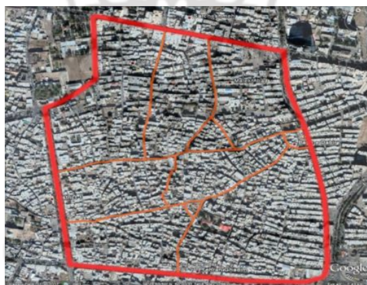
شکل (۲). عکس هوایی محدوده محله بلاغی قزوین