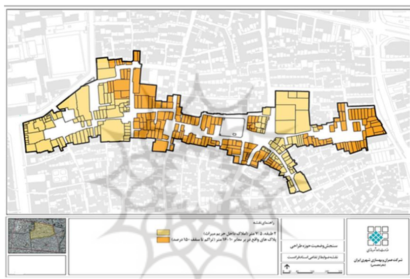
شکل (۳). نقشه ضوابط ارتفاعی محدوده بلاغی

معرف نظم و پیوستگی از جمله راهکارهای پیشنهادی در این زمینه است (Doratli, et al., 2004:331). طبق بند یک صورتجلسه کمیسیون طرح تفصیلی شهر قزوین مصوب شد در منطقه یک شهرداری به منظور تشویق ساختوساز و نوسازی بافت‌های فرسوده به کلیه پلاک‌های واقع در بر خیابان‌های ۱۰ متر تا زیر ۱۶ متر تا سقف ۱۵٪ تراکم تعلق گیرد و کلیه پلاک‌های واقع در بر خیابان‌های ۱۶ متری به بالا مزاد بر ۱۵٪ تراکم تا ۲۰٪ با نظر شهرداری بتوانند از مزایای افزایش تراکم استفاده نمایند. با توجه به وجود آثار ارزشمند تاریخی در حوزه طراحی و مطابق با ضوابط حریم آثار تاریخی، حداکثر ارتفاع ساخت در داخل حریم درجه یک ۴٫۵ متر در یک طبقه و حداکثر ارتفاع ساخت در داخل حریم درجه دو ۷٫۵ متر در دوطبقه می‌باشد که در شکل (۳) ضوابط ارتفاعی حوزه طراحی حدود آن مشخص شده است.