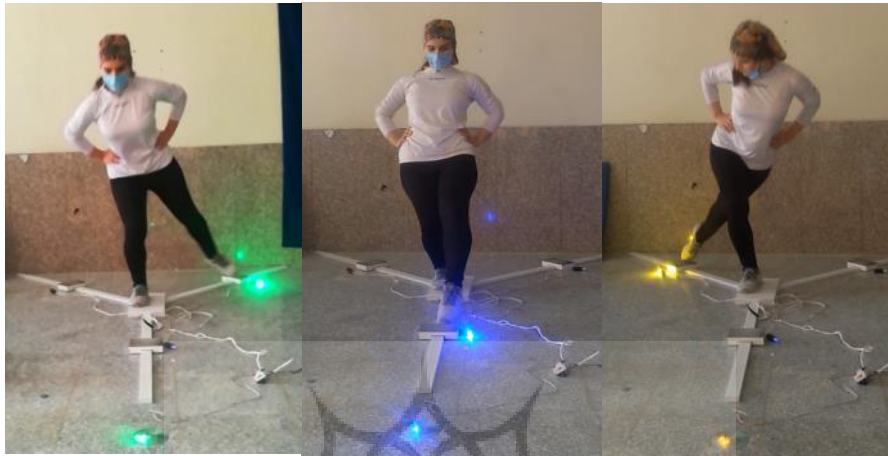
شکل ۲. نحوه اندازه‌گیری تست تعادل واکنشی

در این تست خطاهای تعادل شامل: جدا شدن دست از لگن، قدم برداشتن، سقوط، خم شدن، کج شدن هنگام عمل رساندن پا، بلند شدن پاشنه از سطح ۷، قرار دادن پای آزاد روی زمین بیش از ۲ ثانیه از موقعیت استاندارد می‌باشد.