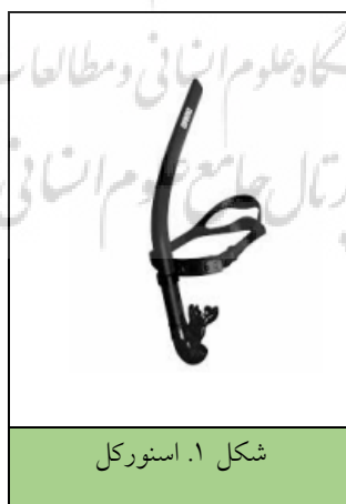
شکل ۱. اسنورکل