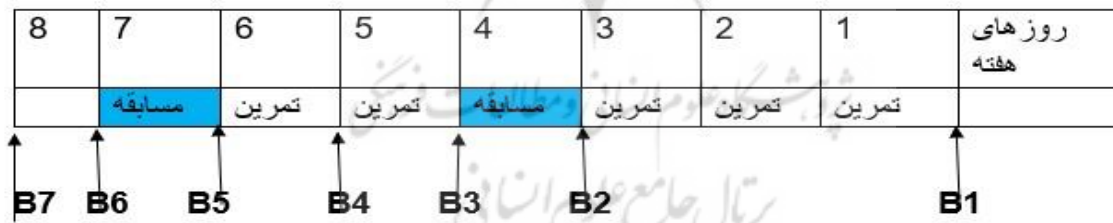
شکل ۱. میکروسیکل هفتگی فوتبال با دو مسابقه در هفته، B (خونگیری).

میکروسیکل هفتگی با حضور فوتبالیست ها و مربیان و جمعی از علاقمندان به فوتبال به عنوان تماشاگر برگزار شد. میکروسیکل هفتگی فوتبال با دو مسابقه در هفته شامل هشت روز از روز شنبه به مدت هشت روز انجام شد. در طول این میکروسیکل دو مسابقه فوتبال در روز های چهارم و هفتم در ساعت پنج تا هفت برگزار شد. در روز های اول، دوم، سوم، پنجم و ششم جلسات تمرین تکنیکی، تاکتیکی و تمرینات بدنی به طور یکسان برای هر دو گروه مکمل و گروه دارونما برگزار شد (شکل ۱). دو نفر از مربیان دارای مدرک مربیگری فوتبال از AFC مربیگری تمرینات و همچنین مربیگری در روز مسابقه را بر عهده داشتند. همچنین داوری دو مسابقه فوتبال را داوهای فوتبال دارای مدرک داوری از کمیته داوران فدراسیون فوتبال ایران بر عهده داشتند. نماینده هیئت فوتبال نیز ناظر داوری و اتفاقات مسابقه را بر عهده داشت. گروه مکمل و دارونما به طور تصادفی به دو تیم تقسیم شدند و دو تیم دارای لباس های غیر هم رنگ (قرمز و سبز) به مسابقه با یکدیگر پرداختند.