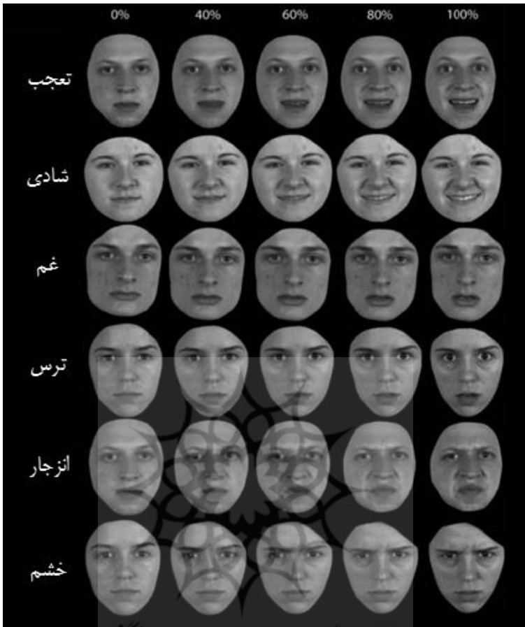
شکل ۱: تصاویر هیجان‌ات اصلی ارائه شده در طول آزمون بازشناسی هیجان

۲- پرسشنامه همدلی: این آزمون توسط دیویس ۱ در سال ۱۹۸۳ طراحی شد و دارای ۲۱ گویه است که میزان همدلی را در افراد مورد بررسی و ارزیابی قرار می‌دهد. نمره‌گذاری این آزمون بر اساس لیکرت ۵ درجه‌ای کاملاً مخالفم (۱) تا کاملاً موافقم (۵) است و نمرات بالاتر نشان از همدلی بیشتر فرد دارد. این پرسشنامه دارای گویه‌هایی برای ارزیابی سه زیرمقیاس دغدغه همدلانه (مانند سوال ۱۵: وقتی می‌بینم کسی مورد سوءاستفاده قرار می‌گیرد، احساس می‌کنم باید از او حمایت کنم)، دیدگاه‌گرایی (مانند سوال ۱۴: وقتی من از کسی ناراحتم، معمولاً سعی می‌کنم خود را چند لحظه جای او