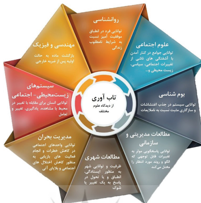
تصویر ۱- مفهوم تاب‌آوری در علوم مختلف (Shamsuddin et al., 2020; Simone et al., 2021): حسنی، ۱۳۹۷؛ رضایی، ۱۳۹۲؛ حیدری‌فر و همکاران، ۱۳۹۷)

واژه تاب‌آوری در دهه ۱۹۹۰ به دنبال ضرورت آمادگی شهرها پیش از وقوع حوادث و همچنین کاهش میزان صدمات مالی و جانی (لطفی و همکاران، ۱۳۹۷، ۲۱۳) و با تاکید بر بهبود زیرساخت‌ها برای پاسخ به تهدیدهای زیست‌محیطی و جلوگیری از تداخل در ساختارهای اجتماعی و نهادی، وارد عرصه برنامه‌ریزی و مدیریت شهری شد (Feng et al., 2020, 1-2). تاب‌آوری شهری با هدف مقابله کوتاه مدت و سازگاری طولانی مدت یک سیستم شهری در برابر تنش‌ها (Cutter et al., 2014, 65)، سعی در افزایش توان مقاومت شهر و به حداقل رساندن خطر فاجعه دارد (پوراحمد و همکاران، ۱۳۹۷، ۱۱۶). به طور کلی تاب‌آوری شهری به سازگاری و انعطاف‌پذیری سیستم و شبکه‌های شهری به منظور حفظ یا بازبایی سریع به حالت ایده‌آل در مواجهه با تداخلات اشاره دارد (Fahlberg et al., 2020, 2; Feng et al., 2020, 2; Simone et al., 2021, 2). این مفهوم، توانایی جذب شوک‌ها و ماندن در یک حالت خاص، توانایی خودسازماندهی و توانایی سازگاری و یادگیری را از جمله قابلیت‌های مهم و مورد نیاز برای شهرهای تاب‌آور می‌داند (Chen et al., 2020, 1; Schelfaut et al., 2011, 825) که در اثر تعامل عوامل و ابعاد مختلف شکل خواهد گرفت (Li et al., 2020, 5; Feng et al., 2020, 1-2).