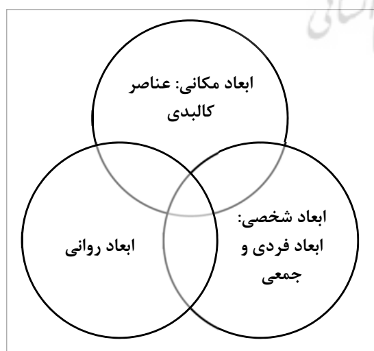
تصویر ۲. مدل دلبستگی به مکان از دیدگاه اسکائل و گیفورد (نگارندگان)

ابعاد روانی دلبستگی به مکان، شامل ابعاد شناختی، عاطفی و رفتاری دلبستگی می‌شوند. بعد دوم، به فرآیندهایی متمرکز است که افراد را به مکان مرتبط می‌نمایند و تعاملات روان‌شناختی آن را شکل می‌دهند. در اینجا، بر سه جنبه روان‌شناختی پیرامون دلبستگی به مکان تأکید می‌شود. این سه جنبه عبارت هستند از: شناخت، عاطفه و رفتار. ابعاد مکانی دلبستگی، به بعد مکانی دلبستگی اشاره دارند که شامل عناصر اجتماعی و کالبدی است که در هر دو محیط طبیعی و ساخته‌شده دیده می‌شود. شاید مهم‌ترین عنصر یا بعد در مفهوم دلبستگی، همان "مکان" است. مکان‌ها به واسطه عوامل مختلف از یکدیگر متمایز می‌شوند؛ اندازه، مقیاس و زمینه و همین‌طور به واسطه ماهیت مادی یا کارکرد نمادین