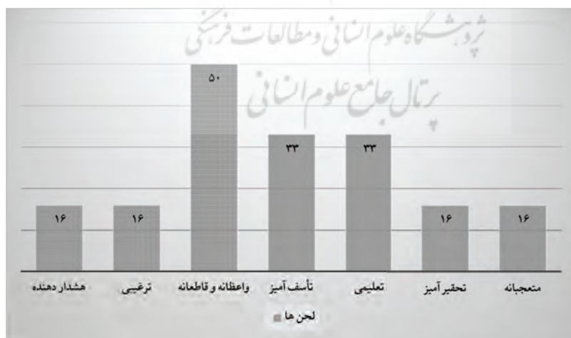
نمودار ۲. بسامد به کارگیری انواع لحن در زبان راوی داستانک‌های تک‌آیه‌ای

شخصیت‌ها می‌شود لحن دانا و واعظانه و لحن مصرانه و جاهلانه. یکی از لطایف مبحث شخصیت‌پردازی و ارتباط آن با لحن، لزوم تغییر لحن شخصیت‌های حکایت، متناسب با تغییر شخصیت پویا در طول روایت است. هرچند معمولاً داستانک، مجال تغییر و پویایی شخصیت‌ها نیست در برخی داستانک‌های قرآنی این اتفاق افتاده است. برای مثال داستانک عزیر نبی (بقره/۲۵۹) در ابتدای داستان، شخصیت اصلی دارای لحنی متعجبانه و جاهلانه است و در نهایت به لحنی دانا و نادمانه منجر می‌رسد. ۱-۵. لحن راوی: در داستانک‌ها معمولاً توصیف‌های کوتاه لحن راوی (خداوند) را نسبت به فرد توصیف شده نشان می‌دهد. این نوع صفات از دیدگاه لحن، قاطعانه هستند که معمولاً در خدمت لحن واعظانه و هدف‌گایی راوی است. در داستانک عزیر نبی، چندین مرتبه از راوی داستان، افعال امری صادر می‌گردد در نتیجه لحن راوی، واعظانه است و همانطور که می‌بینیم ضمایر دوم شخص و افعال امری دلالت‌های آشکار برای لحن واعظانه در این داستانک دارند، در داستانک فرار از مرگ، لحن راوی قاطعانه و واعظانه است و در انتهای داستانک لحن راوی تأسّف‌آمیز است. در داستانک محاجه ابراهیم، لحن راوی در ابتدای داستان لحن تعلیمی است و در انتها لحن راوی تحقیرآمیز است؛ در داستانک نشان دادن معاد به ابراهیم (ع)، لحن راوی قاطعانه و واعظانه است و در اواسط داستانک، لحن متعجبانه می‌شود؛ در داستانک یار غار پیامبر، لحن راوی در ابتدا لحنی ترغیبی است و در انتهای داستانک دارای لحن هشدار دهنده است؛ لحن راوی در داستانک ملک سلیمان، در ابتدا لحنی تعلیمی دارد و در انتها دارای لحن تأسّف‌آور است.