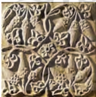
تصویر ۲. کاربرد نقش بلوط در گچ‌بری‌های کاخ تیسفون و کیش، حدود قرن ۶ میلادی، منبع: (اعظمی، شیخ‌الحکمایی و شیخ‌الحکمایی، ۱۳۹۲: ۱۸).

افزون بر مضامین دینی و مذهبی پیرامون شاخه زیتون، آن را به منزله عنصری کارآمد در نشان‌های ملی و نشان‌های افتخار در نظر می‌گیرند که معمولاً در کنار شاخه بلوط ظاهر می‌شود. بلوط نشان‌دهنده عمر طولانی و قدرت مردانه است. در ایران بلوط دارای جایگاهی اسطوره‌ای است و به منزله درختی تنومند با عمری طولانی شناخته می‌شود. عصر ساسانی را می‌توان دوره‌ای با کاربرد فراوان عنصر تزئینی بلوط دانست که علاوه بر این کاربرد، نشانه‌ای از امنیت، باروری و دوام است و قرینگی را به نمایش می‌گذارد. (تصویر ۲) (مبینی، شافعی، ۱۳۹۴: ۵۶). استفاده از بلوط در نشان شیر و خورشید قاجار می‌تواند به این دوره تاریخی پیشین هم اشاره داشته باشد. زیتون به معنی شکوه صلح، جادوانگی و بلوط به معنی باروری، دوام و زندگی، توأمان دست در دست هم داده‌اند و بر شدت معنای نشان در سمت بیرونی افزوده‌اند.