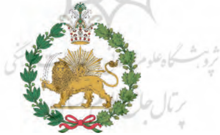
تصویر ۱. نشان ملی متعلق به حکومت قاجار

با شکل‌گیری حکومت قاجار ۱ و ایجاد تغییرات اجتماعی- سیاسی در این دوره، نشان شیر و خورشید به اشکال و انحاء مختلف به کار رفته است. دوران قاجار با قدمتی طولانی، پادشاهان متعددی را به خود دید که هرکدام سیاست‌های خاص خود را در اداره مملکت داشتند و به تبع آن نشان شیر و خورشید را به عنوان معرف حکومت تغییر می‌دادند. نشان قاجار را می‌توان در دو گروه عناصر طبیعی و غیرطبیعی تقسیم‌بندی نمود. عناصر طبیعی که عبارتند از نقوش گیاهی (شاخه بلوط و زیتون)، نقوش حیوانی (شیر) و پدیده‌های طبیعی (طلوع خورشید). در دسته عناصر غیرطبیعی نیز می‌توان به اشیا و آلات جنگی (شمشیر) و پوشش سلطنتی (تاج) اشاره نمود.