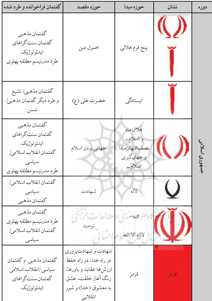
جدول ۲. بررسی عناصر تشکیل دهنده نشان جمهوری اسلامی و معانی و گفتمان مربوط به آن‌ها

(تصاویر: ندیمی، ۱۳۶۲: ۶۱؛ جدول: نگارندگان)