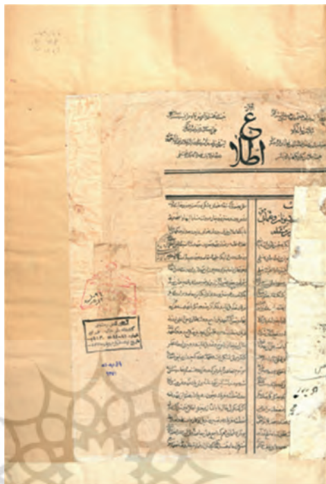
تصویر ۳. صفحه آغازین نشریه اطلاع برای انتشار وقایع و حوادث عمده تمام کره ارض