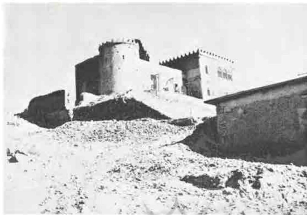
تصویر ۱: قلعه آقامحمدخانی احداث شده در باغ تخت شیراز از نمای جنوب غربی (اسلامی، ۱۳۵۰: ۵۹).