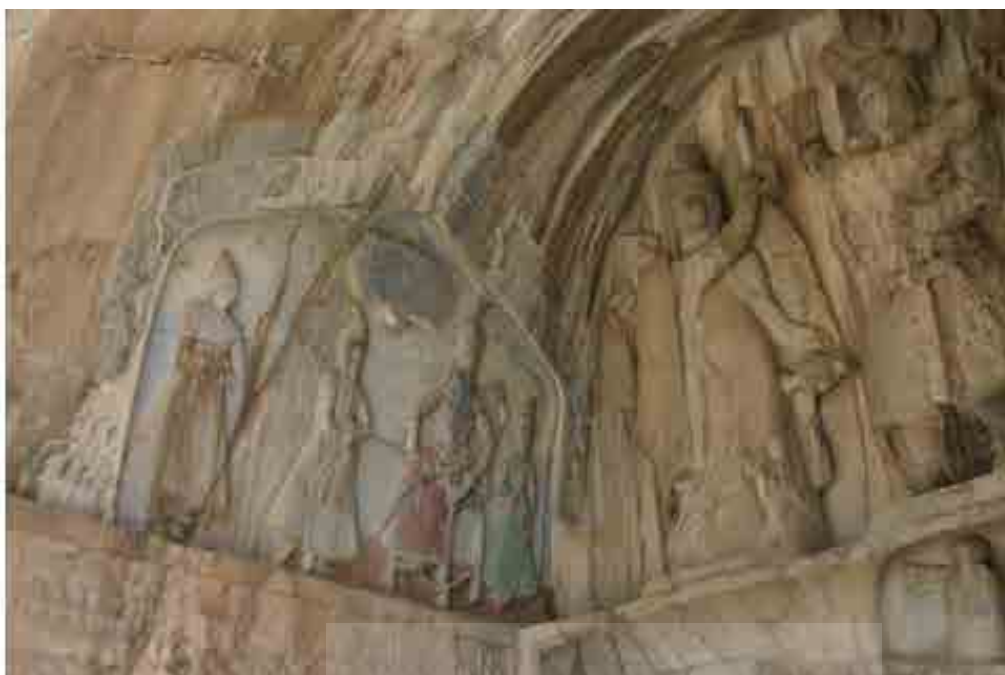
تصویر ۲: نقش برجسته جلوس فتحعلی شاه قاجار که به نقش برجسته عصر ساسانی طاق بستان اضافه شده است (Grigor, 2007).