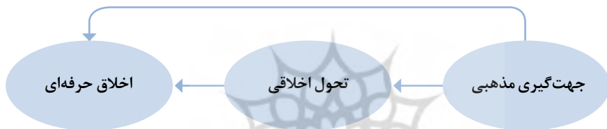
شکل ۱. الگوی پیشنهادی پژوهش

جهت‌گیری مذهبی بر اخلاق حرفه‌ای معلمان اثر مستقیم دارد. جهت‌گیری مذهبی به واسطه متغیر میانجی تحول اخلاقی بر اخلاق حرفه‌ای معلمان اثر غیرمستقیم دارد و در نهایت، آیا مدل روابط ساختاری جهت‌گیری مذهبی و اخلاق حرفه‌ای معلمان با میانجیگری سطوح تحول اخلاقی با داده‌ها برازش دارند؟ مدل مفهومی پیشنهادی پژوهش در شکل ۱ ارائه شده است.