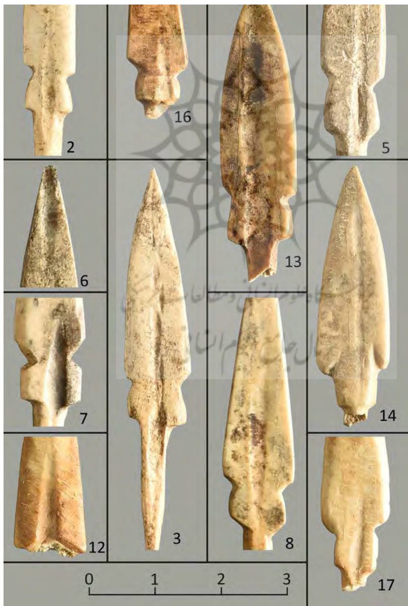
Fig. 3: Some details on the Ziwiye bone arrowheads.