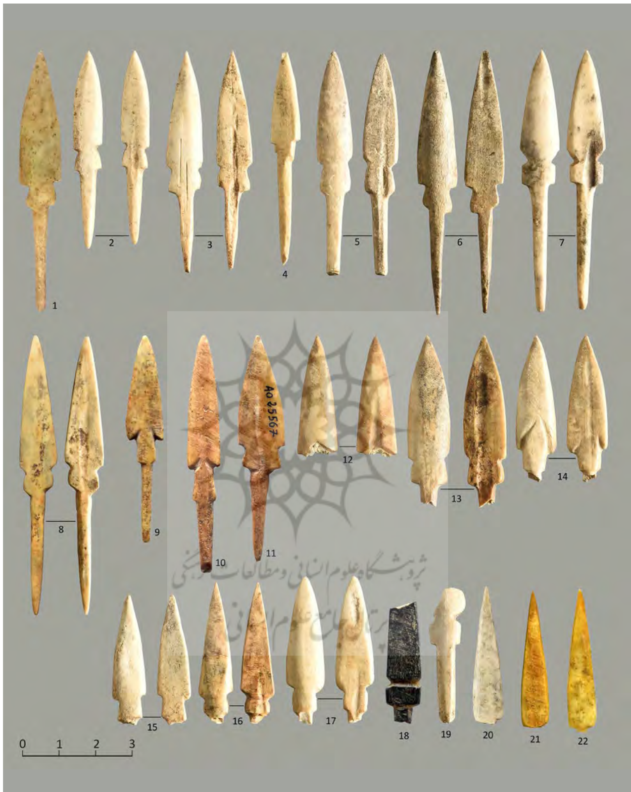
Fig. 1: Bone arrowheads with a leaf-shaped blade from Ziwiye; These samples are housed in The Metropolitan Museum of Art (No. 1; ©The Metropolitan Museum of Art, Photo by: Narges Bayani), Sanandaj Museum (Nos. 2 to 8, 12 to 20; ©The Sanandaj Museum, photo by: Nima Fakoorzadeh and Neda Tehrani), Musée du Louvre / Antiquités Orientales Department (Nos. 9 to 11; ©Musée du Louvre, photo by: Yousef Hassanzadeh), National Museum of Iran (Nos. 21 to 22, ©National Museum of Iran, Photo by: Yousef Hassanzadeh).